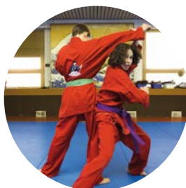
OPTION JEUX SPORTIFS ET D'OPPOSITION (JS/JO)