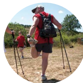
OPTION ACTIVITÉS DE RANDONNÉE DE PROXIMITÉ ET D'ORIENTATION (ARPO)

La formation CQP ALS est la première étape de qualification professionnelle du métier d'Animateur Sportif des activités physiques pour tous.