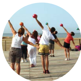
OPTION ACTIVITÉS GYMNINIQUES D'ENTRETIEN ET D'EXPRESSION (AGEE)